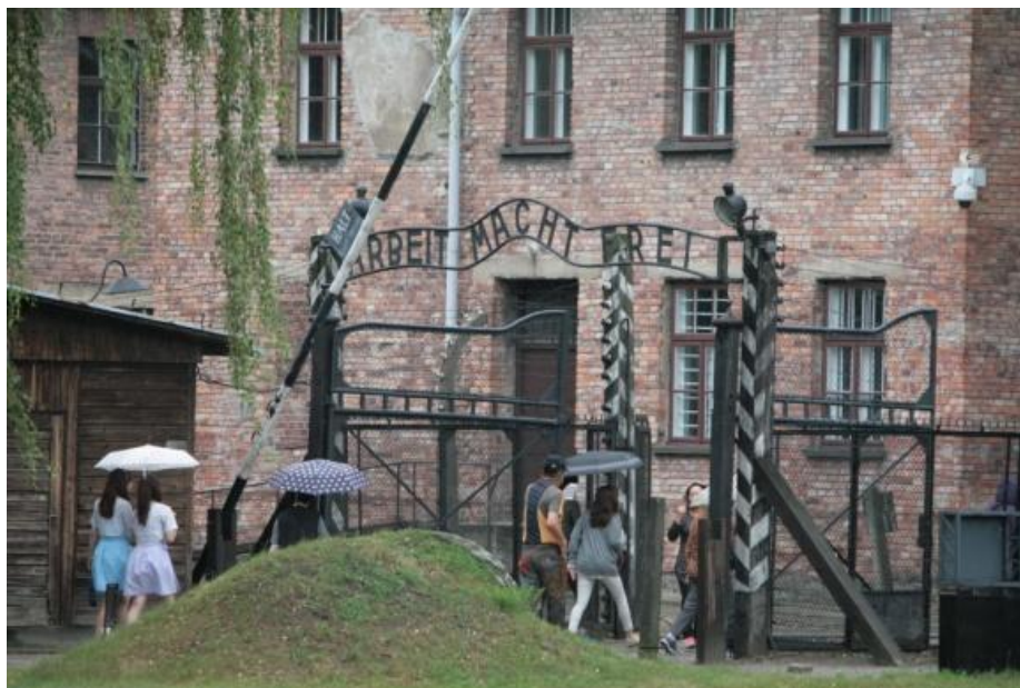
Porten till helvetet

Dagens program bestod av ett besök i koncentrations- och förintelslägret Auschwitz - Birkenau. Framme i Auschwitz slutade regnet mer eller mindre och förmiddagen bjöd på omväxlande gråmulet väder med inslag av regnskurar. Detta var säkerligen bra för sinnesstämningen, att besöka Auschwitz i vackert väder förtar nog en del av platsens mörka historia. En bra guide som talade perfekt svenska, förde oss genom detta monument över ondskan och beskrev på ett korrekt men medryckande sätt hur det dagliga livet och den ständigt närvarande döden gestaltade sig för lägerfångarna. Vi vandrade in i lägret under den så välkända devisen "ARBEIT MACHT FREI". Till skillnad från de över en miljon 1 människor som förintades i lägret visste vi att vi skulle överleva besöket.