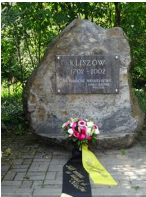
Minnessten vid Kliszow från slaget 1702.

Efter genomgången på slagfältet besökte vi minnesstenen som finns i utkanten av byn Kliszów. Även här förärade vi våra forna regementskamrater en bukett blommor och ett gul/svart band med texten Värmlands Regementes Officerskår. Som sig bör hölls också en tyst minut för de som stupade i slaget. Enligt historieskrivningen stupade endast en Värmlandsinfanterist.