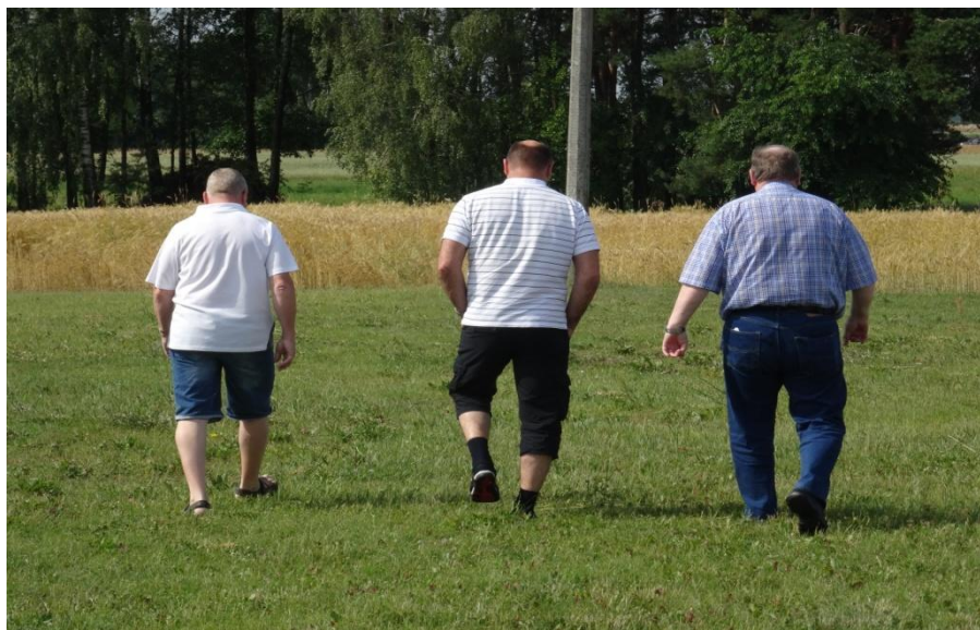
Med många dryckesstopp blir det så att man också måste lätta på trycket. Här är det tre breda herrar som skall besikta den polska landsbygden.

Fortfarande i strålande väder med en temperatur över 30 grader, gjorde att det blev det många ”dryckesstop” efter vägen. De som inte drack öl kunde svalka sig med glass eller annan dryck.