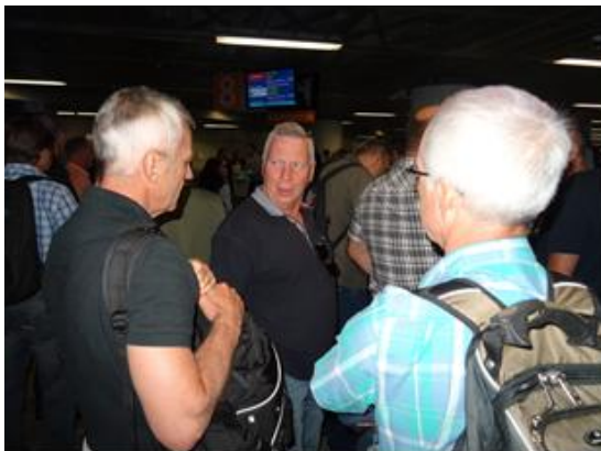
Fan, dej känner jag igen, är du den där kände författaren från Kallsta?

Något försenat lyfte planet från Gardemoen med destination Warszawa. Vi landar i ett mycket varmt Warszawa (+ 34 grader) och nu börjar problemen, var är vår buss?