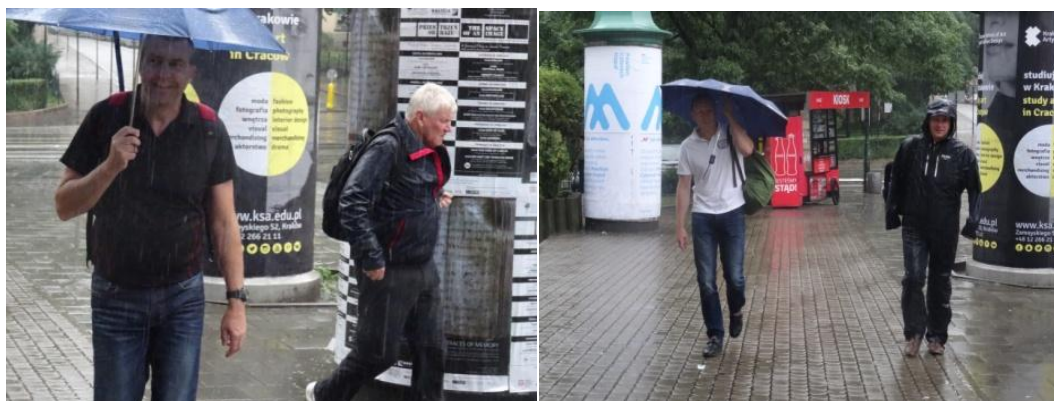
Några hade paraply, andra inte.

Vaknar av att det regnar ute. Detta är en av de få gånger som det har regnat på våra resor, men nu kom det desto mer. Sannolikt ett omen inför besöket på platsen för ett av mänsklighetens mörkaste illdåd.