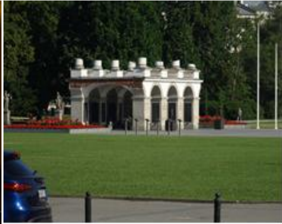
Alldeles utanför hotellet fanns den okände soldatens grav.