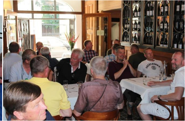
Här är det fler som väntar på sin öl.

Efter en mycket god lunch, godast var nog den kalla ölen som släckte våra törstande strupar efter "hård" fotvandring, blev det åter en bussresa nu mot saltgruvan i Wieliczka.