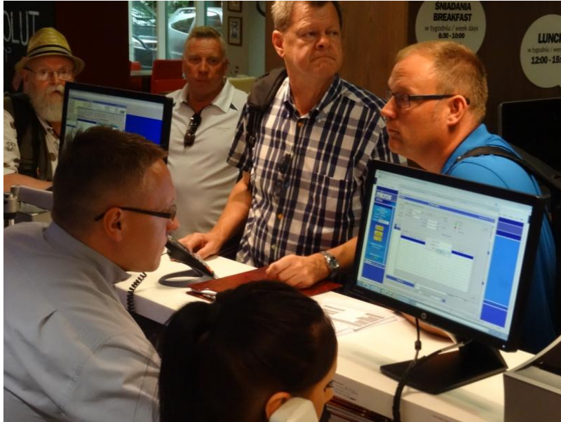
Två rutinerade herrar skötte incheckningen, en på engelska och en på värmländska.

Tyvär var det en del av rummen som inte hade fungerande air-condition vilket innebar svettningar första natten för vissa. För de som hade rum ut mot gatan var det heller ingen idé att öppna fönstret eftersom det pågick party till långt fram på nätterna i staden. Efter hand löste hotellet problemen och jag tror att till slut hade alla fått rum som de var nöjda med. Kvällen var varm och ljum och de flesta vandrade ut i nöjeslivet i Krakow för middag och något starkt att dricka.