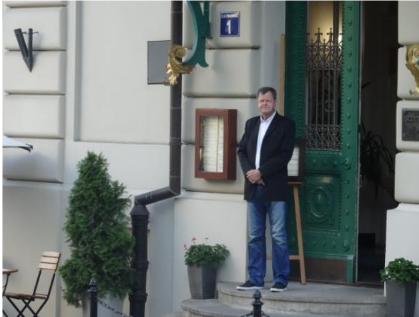
Här har de ställt ut post nr 1 som skall bevaka att inga onyktra kommer in och stör ordningen under kalaset.