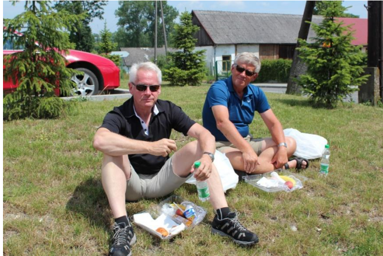
Många intog den medhavda lunchen i bar överkropp eftersom det var en fantastiskt varm dag, men dessa hårdhudade herrar klarar lätt en varm dag utan besvär.

Efter genomgången på slagfältet besökte vi minnesstenen som finns i utkanten av byn Kliszów. Även här förärade vi våra forna regementskamrater en bukett blommor och ett gul/svart band med texten Värmlands Regementes Officerskår. Som sig bör hölls också en tyst minut för de som stupade i slaget. Enligt historieskrivningen stupade endast en Värmlandsinfanterist.