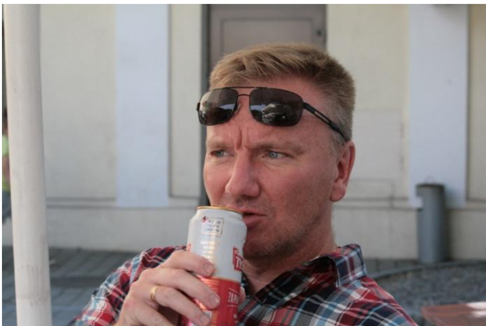
Funderar kanske på vad jag har varit med om under dagen.

Efter hemfärden var eftermiddagen fri för olika egna aktiviteter. Många fortsatte att utforska de många sevärdheter som finns i Krakow gamla stad.