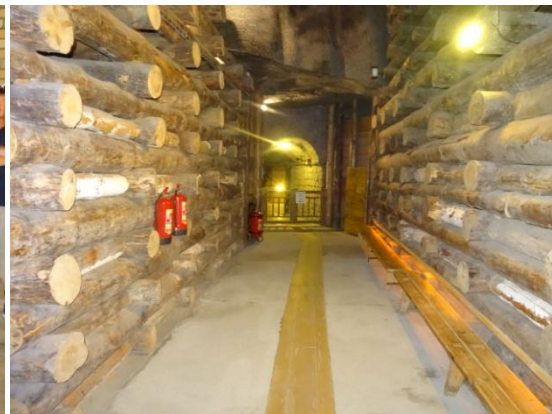
En av våra guider och så här såg det ut nere i saltgruvorna

En vandring rakt ned i underjorden med en nivåskillnad på ungefär 125 meter. En helt fantastisk upplevelse att besöka detta världsarv. Otroligt bra iordningställt, de kilometerlånga gångarna i gruvan var klädda med grovt timmer. I slutet av vandringen kom vi fram till ett köpcentrum i miniatyr med alla slags souvenirer och glass, kaffe och andra goda drycker.