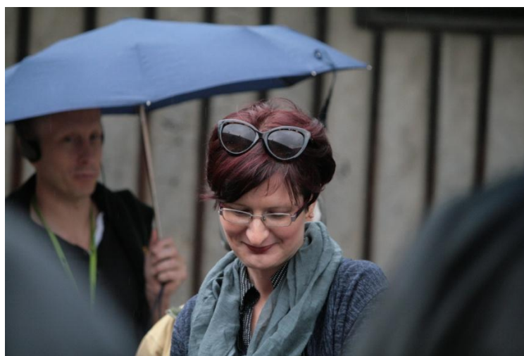
En av våra polska guider som var med och såg till att allt gick rätt till.