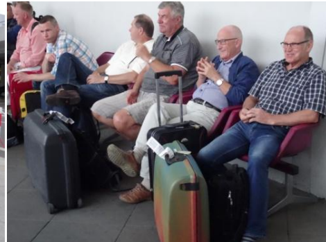
Reine du lurade oss, där fanns ingen buss, nu sätter vi oss här tills du fixat fram bussen.