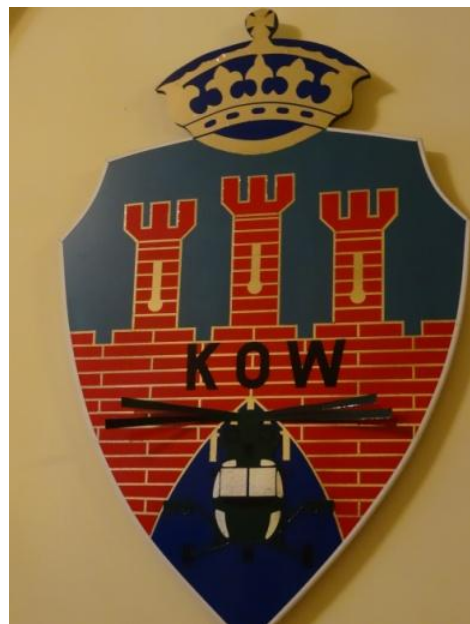
Detta var den vapensköld som satt i lokalen och som förkunnade militär historia.