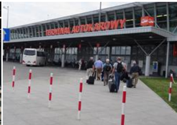
Nu går vi mot bussen.