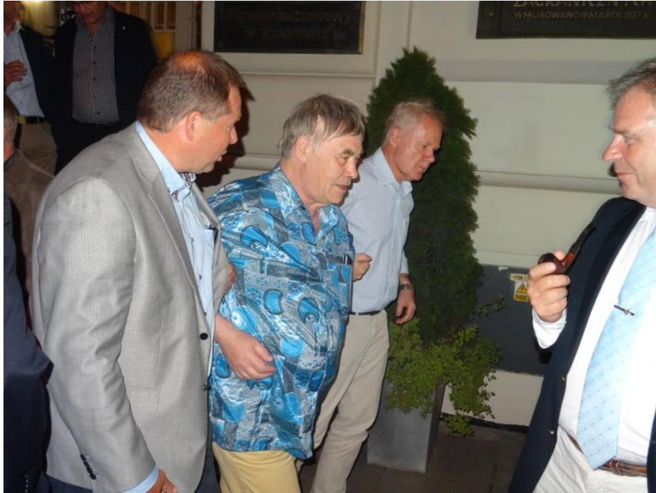
Somliga fick ledas hem efter festen?