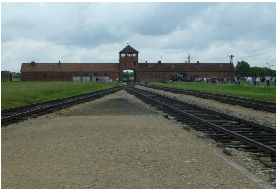
Här kom tågen genom porten till perrongen där fångarna selekterades. De arbetsföra till förlägningsbarackerna och de andra direkt till gaskamrarna.

Efter besöket i Auschwitz I gick vi över till själva förintelslägret Birkenau (Auschwitz II) där järnvägen som leder mot förintelsen går in genom den berömda porten.