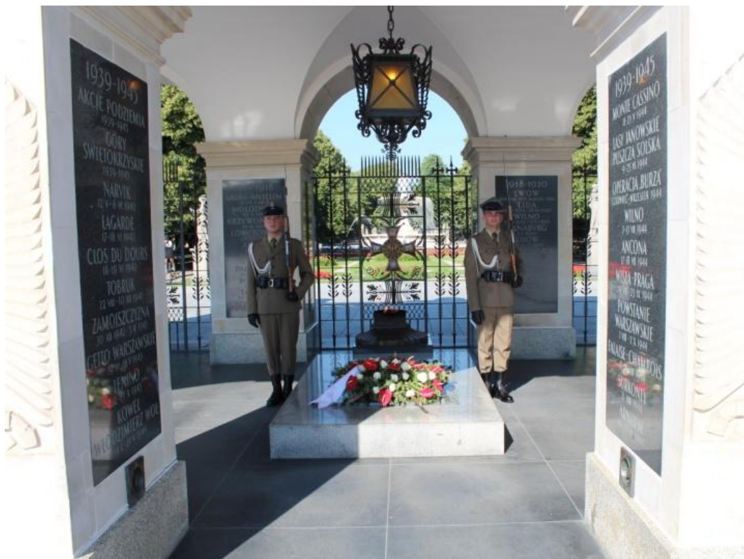
Vaktsoldater vid den okände soldatens grav.