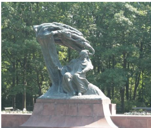
Ett besök i Mozart parken var ett måste på vår rundtur.

Efter en god frukost började vi dag 2 med en rundtur både i buss och till fots i Warszawa. Vår guide var en påläst äldre dam som visade oss det mest intressanta i stan.