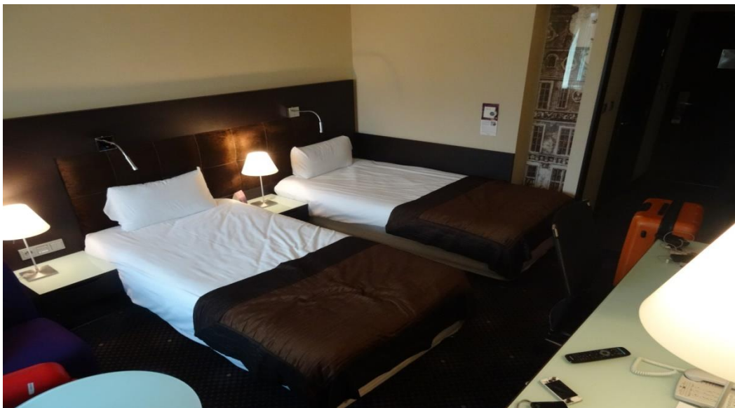
Vi bor fint på våra resor, inget tält och ingen halm utan sidenlakan gäller nu.

Återigen en snabb incheckning på hotell för att sedan i samlad trupp bege oss till det KGB museum som finns i Vilnius.