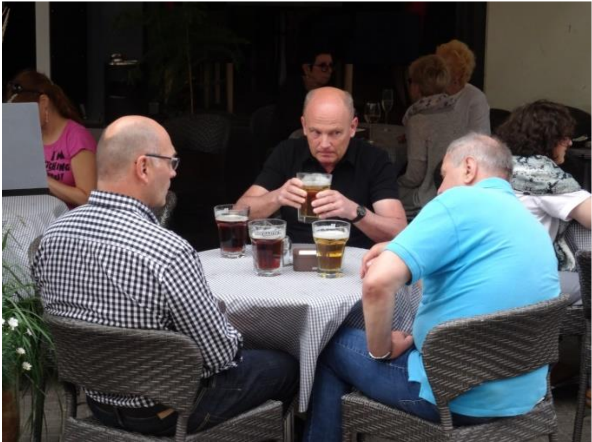
Nja, de ble ingen mat, men öl hade de.