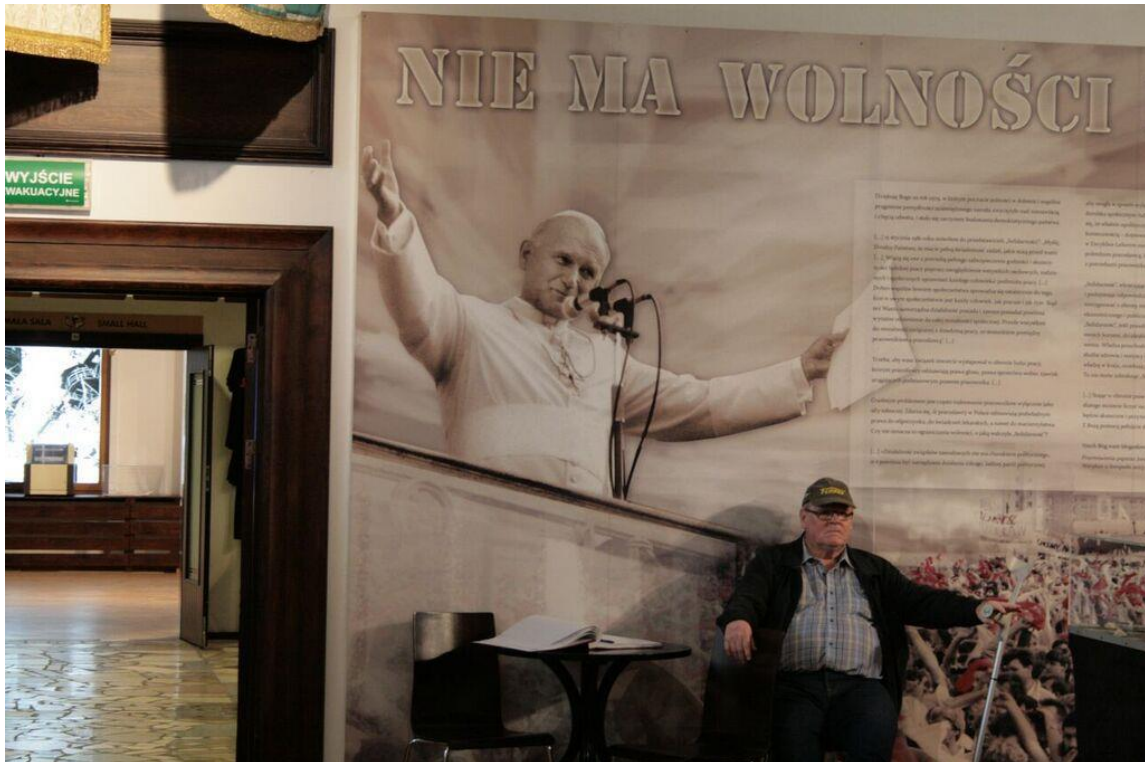
Två påvar med olika budskap.