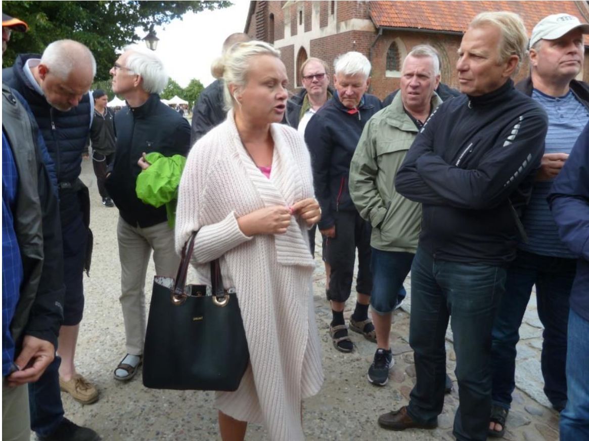
Vår guide på Tyska ordensborgen i Malbork.

Nu följde en 2,5 timmes lång guidning i borgen med många intressanta och fina rum att beskåda. Något som var speciellt var att det fanns små hål i golvet på vissa ställen och dessa hål visade sig vara för uppvärmning av borgen, den varma luften leddes i rör från källaren där det eldades i någon form av eldstad. Sinnrikt på den tiden. En mycket intressant guidning avslutades vid souvenirbutiken och vi drog oss så sakta mot bussen igen.