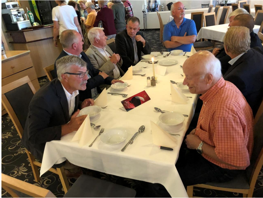
Stiliga herrar i väntan på gemensam middag.

Mragowo där vi bodde firade 200 års jubileum och det var verkligen festligt ute på byn med musik, försäljning av mat, marknadsstånd och mycket publik.