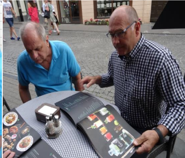
Det kanske är bättre om vi sitter ner?