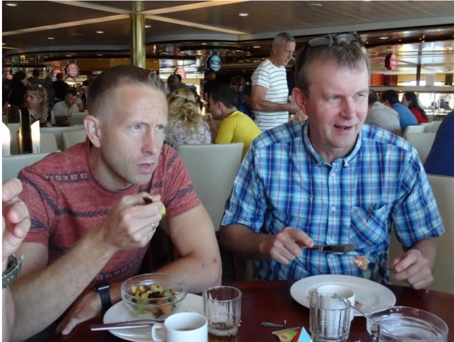
En god frukost är inte fel.