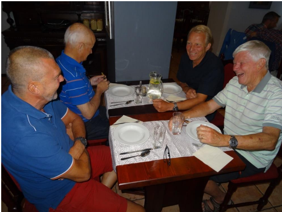
Ett glatt gäng som bara fått in vatten!!!!!!