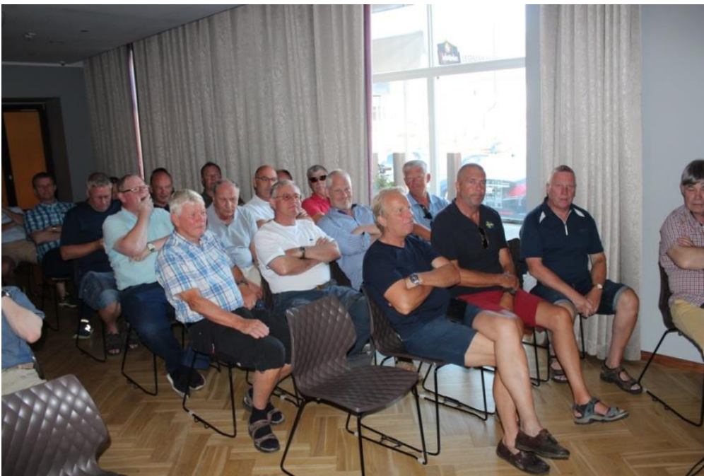
.....och här sitter intresserade åhörare

Efter genomgången var det snabbt ut i vimlet i gamla stan för mat och dryck.