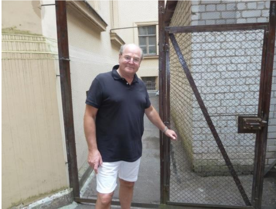
Här var grinden till frihet, C-G har tur och får gå ut i det fria.

visade på många grymheter och avrättningar förekom ända fram till början av 1960-talet.