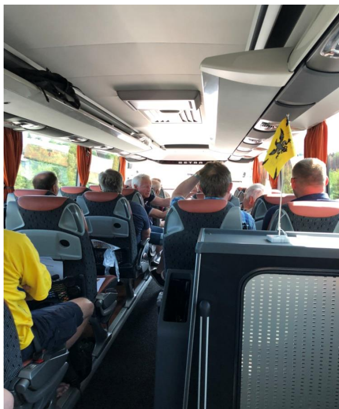
På väg mot nya djärva mål!