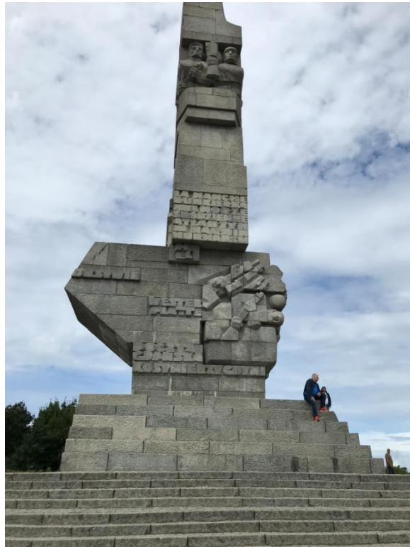
Monumentet på Westerplatte.