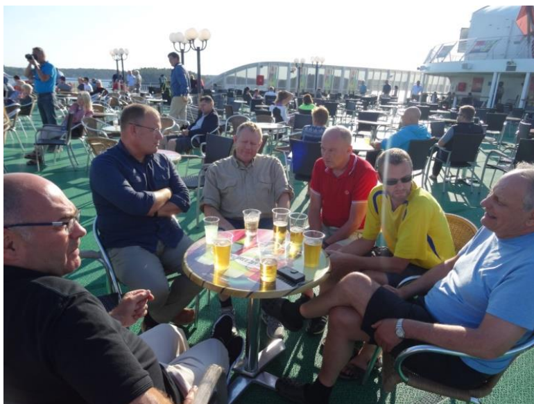
Det var fler som började med en öl på akterdäck

Vissa gick direkt till olika barer där fotbollen visades. Efter att Sverige gjort 2-0 på Mexico kunde man se att de flesta sökte sig ner till barerna för att se avslutningen på matchen. En överlägsen seger för Sverige gjorde att det var många rusiga supportrar som gick till sina hytter för att byta om till kvällens gemensamma middag.