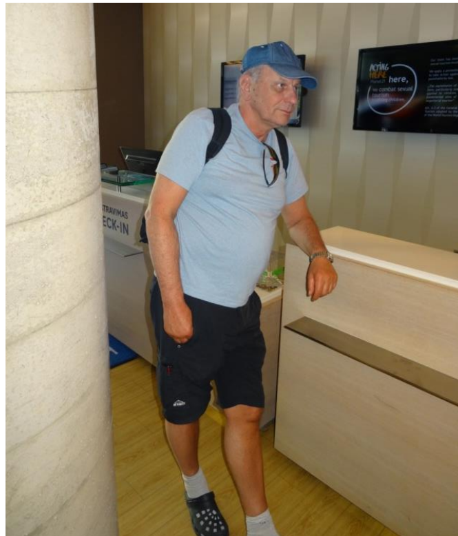
Gud vecka ti dä tar inna en får nöckeln.