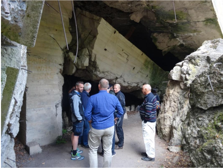
Ordentliga byggen i typisk tysk stil?