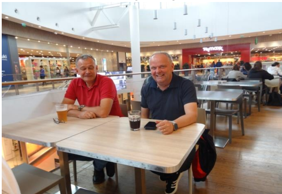
Det är bara cola i glaset.