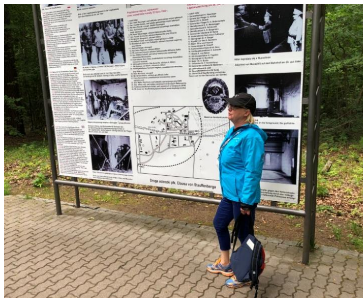
Här visar guiden en karta över "Varglyan".

Mätta och belåtna möttes vi av en pigg och hurtfrisk guide som skulle visa oss Wolfsschanze (Hitlers "varglya" egentligen Vargskansen) som var ett av Hitlers 7 högkvarter. En intressant rundvandring som leddes av en guide som verkligen hade talets gåva och som småsprang runt med oss bland mängder med bunkrar.