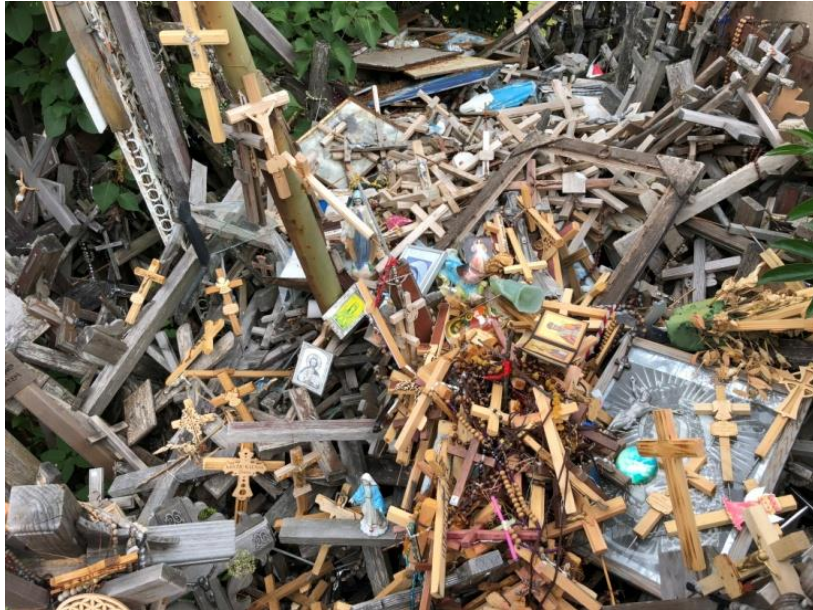
Mängder av kors i olika storlekar och former.