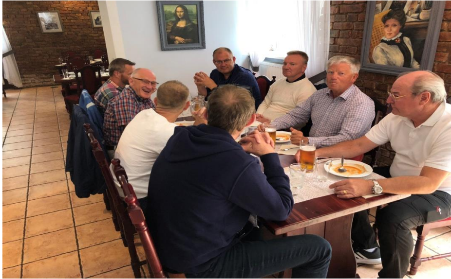
Ett hungrigt gäng som har fått in soppa och öl.

Mätta och belåtna möttes vi av en pigg och hurtfrisk guide som skulle visa oss Wolfsschanze (Hitlers "varglya" egentligen Vargskansen) som var ett av Hitlers 7 högkvarter. En intressant rundvandring som leddes av en guide som verkligen hade talets gåva och som småsprang runt med oss bland mängder med bunkrar.