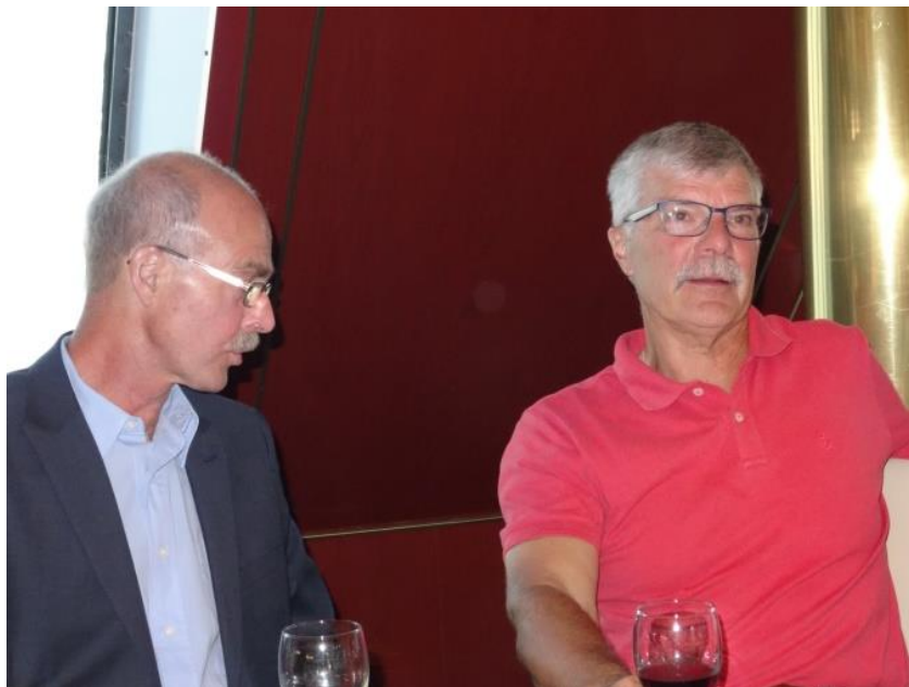
Vissa blev kvar lite längre i baren.

Problemet var att vi hade bokat gemensam middag till 20. 30 och när klockan visade 20. 15 så visste vi att vi kommer att inte hinna i tid. Strax efter 20. 30 blev vi till slut insläppta och strax före 21.00 satt alla i restaurangen för att äta gemensam middag. Middagen förlöpte utan problem och nu var det dags för ett sista besök i taxfree och sedan i bädd.