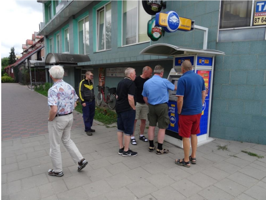
Tror ni det finns kaffe i denna maskin?