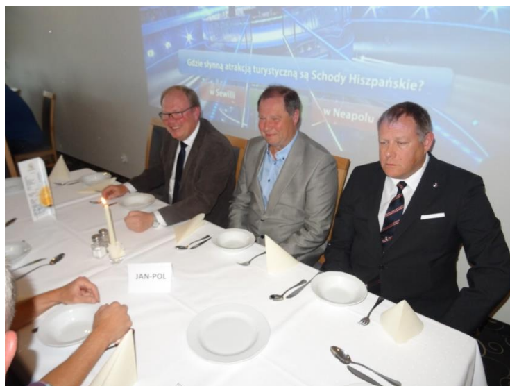
Vackra herrar i väntan på maten.

Efter detta flyttade vi oss upp en våning till matsalen där vi bjöds på middag i form av buffé. Naturligtvis drack vi både öl och snaps och därtill naturligtvis sjöngs det naturligtvis ”En värmlandspöjk” med mera så bra att vi fick applåder av övriga gäster i matsalen.