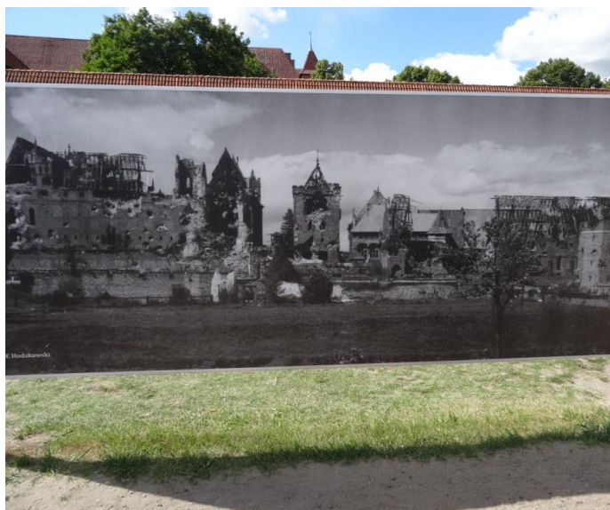
Så här såg borgen ut 1945 efter andra världskrigets slut, nästan totalt ödelagd.