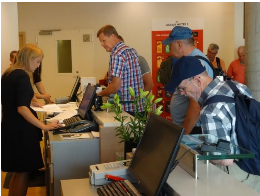
De här är inte lätt när de ställer frågor på utrikiska.

Nu påbörjades den sista delen av dagens resa som var cirka 15 mil fram till slutmålet Novotel hotell i Vilnius.