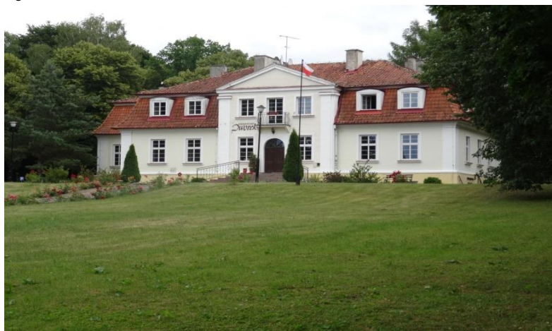
Hotell Ksiezycowy Dworek

Efter bra orientering av Björn med flera rullar vi in på en mindre skogsväg fram till vår lunchrestaurang på hotell Ksiezycowy Dworek. Ett stort hus vackert beläget vid en sjö.