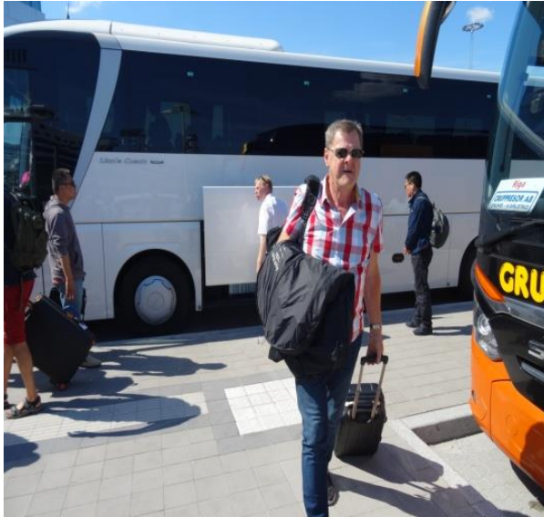
Reseledaren på väg till båten.