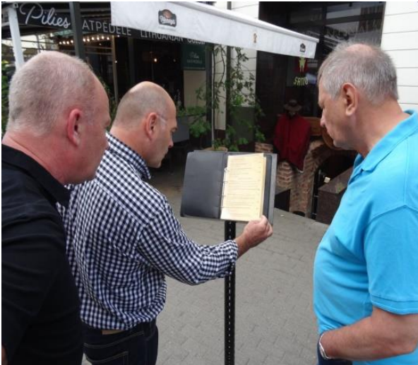
Unrer va di har å äte här?