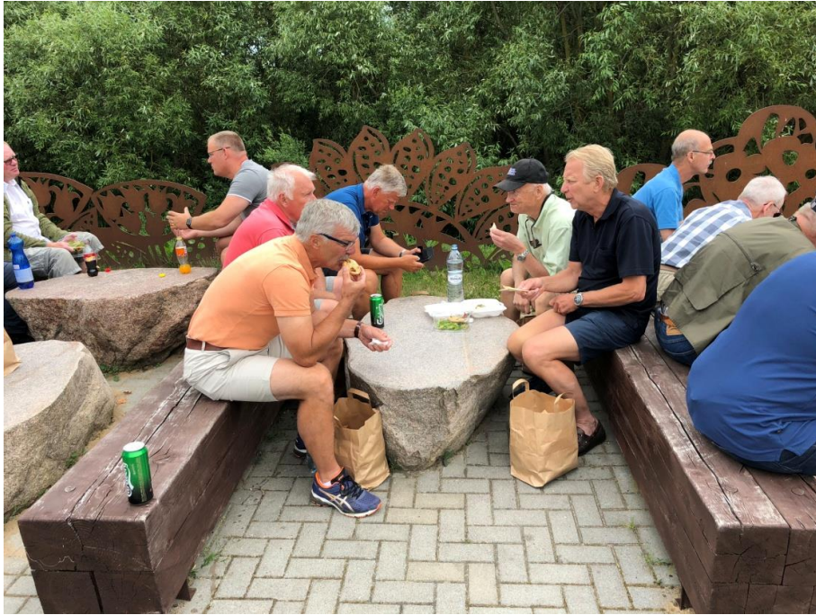
Lurpack är en beprövad utspisning för alla som deltog i resan.

Nu påbörjades den sista delen av dagens resa som var cirka 15 mil fram till slutmålet Novotel hotell i Vilnius.