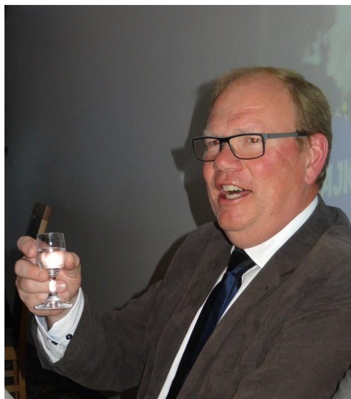
Här är det en riktig värmlandspöjk som kan ta både ton och sup.