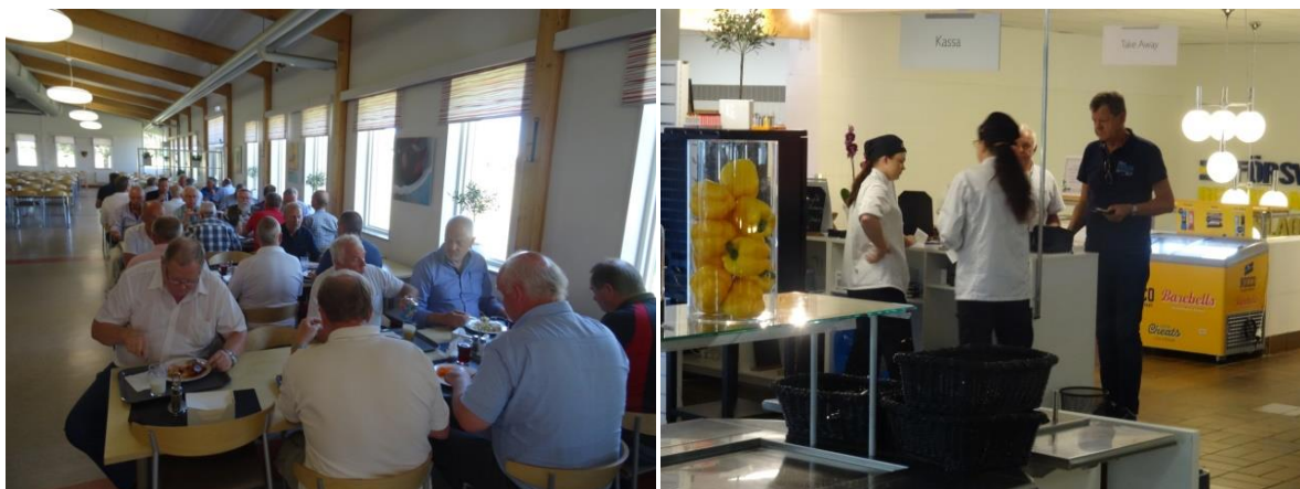
Lunch på militärrestaurangen i Skövde och som vanligt "siste man betalar".

Här var det fler som lämnade resan för att ta sig både väster och öster ut och vi drog vidare norrut. Ett sista stopp i Kristinehamn där några lämnade och sedan var det raka spåret till Karlstad och järnvägsstationen. I vår reseplanering hade vi sagt ankomst Karlstad cirka 15.30 och bussen gled in på Centralstationen 15.28. Några deltagare följde med bussen till Karlstad hemvärnsgård där bilar var parkerade och en del blev hämtade.