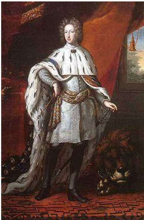
Karl XII porträtterad 1697 av David Klöcker Ehrenstrahl.

Uniform buren av Karl XII i Fredrikshald den 30 november 1718, då han dog. Finns idag i Livrustkammaren.