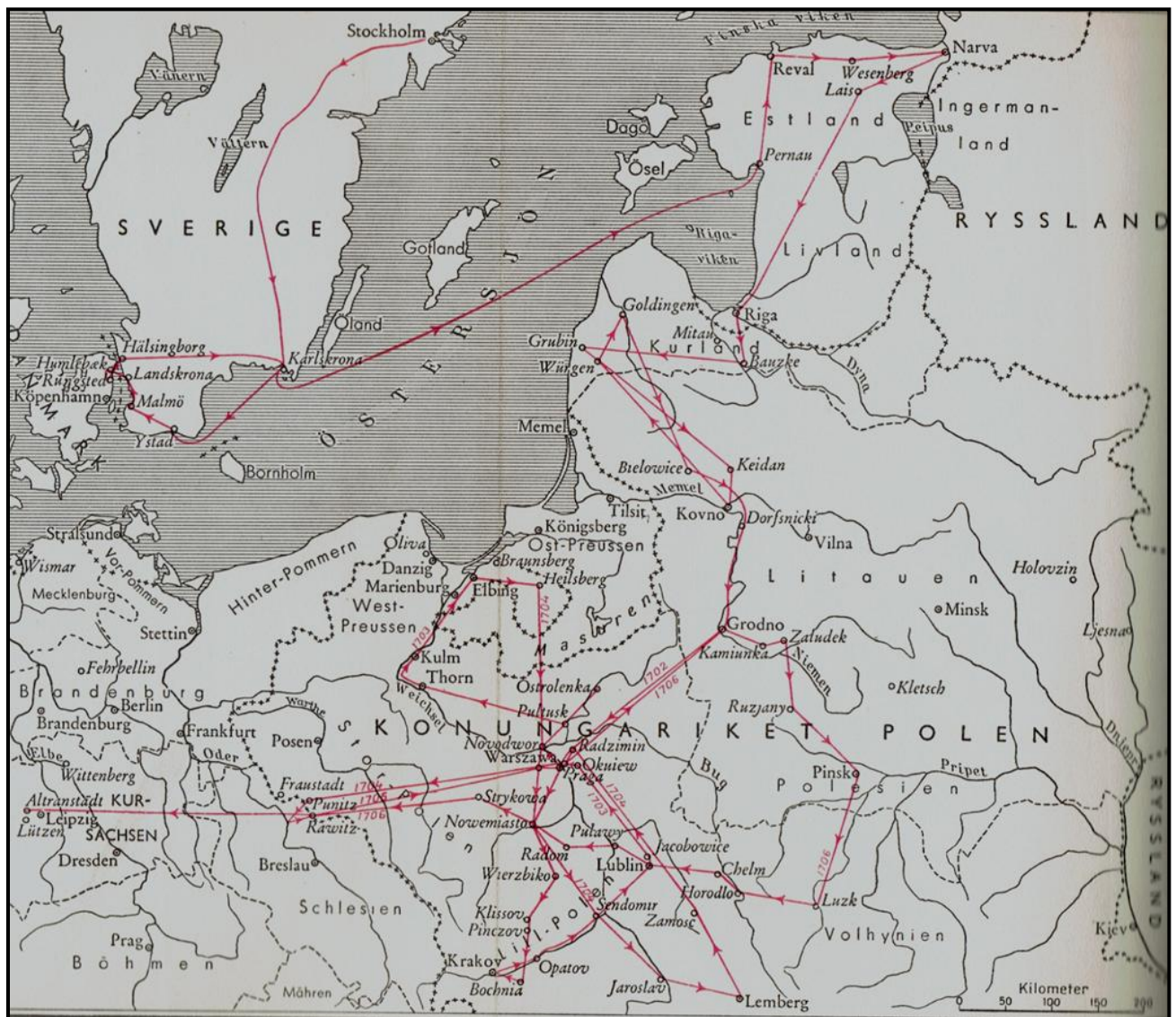
Fälttågen i Polen.

När Danmark hade tvingats till fred 1700, och den ryska armén hade besegrats vid Narva i november samma år, gick Karls plan ut på att slå den sachsiska armén. Detta var nödvändigt för att med relativt säkrad rygg kunna marschera mot Pskov och Moskva i syfte att besegra