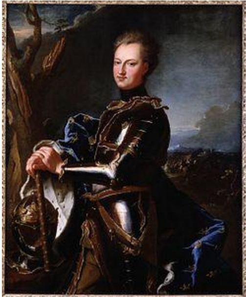
Karl XII avporträtterad 1715 av Hyacinthe Rigaud.

Karl XII:s fullständiga titel på svenska löd: Carl med Guds Nåde, Sveriges, Götes och Vendes Konung, Storfurste till Finland, Hertig uti Skåne, Estland, Livland, Karelen, Bremen, Verden, Stettin, Pommern, Kassuben och Venden, Furste till Rügen, Herre över Ingermanland och Wismar, så och Pfalzgreve vid Rhen, i Bayern, samt till Jülich, Kleve och Berg Hertig. Greve till Valdens, Spanheim, Mark och Ravensburg och Herre till Ravenstein.