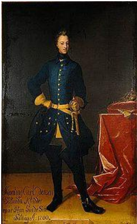
Karl XII år 1700, målning av David von Kraft från 1706.

Även i utrikespolitiken sökte Karl XII vägledning från faderns politiska system. Grundpelarna var en neutral hållning i Västeuropas stora konflikter, vänskap med sjömakterna England och Nederländerna och om möjligt även med Frankrike. Slutligen måste Danmark hållas under uppsikt och försvagas genom allianser med huset Hannover och kraftigt understöd åt hertigen av Holstein-Gottorp.