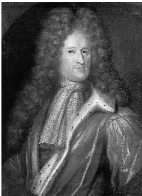
Kavallerigeneral Otto Vellingk (1649–1708), senare riksråd, övertog befälet över vänstra flygeln och slog tillbaka den polska kronarmén.

utnämndes han 1698 till generallöjtnant och friherre. 1705 blev han kungligt råd och 1706 vann han en lysande seger vid Frauenstadt där han med 9 000 man lyckades slå fiendens 18 000 starka här. För denna seger belönades han med fältherrestaven och grevetiteln. Han kom inte så bra överens med kungens andra gunstling, Carl Piper då de hade olika åsikter rörande krigföringen, vilket bidrog till nederlaget vid Poltava. Han blev tillfångatagen och fördd till Ryssland, där han, och Piper, fick ta hand om de övriga fångarna. 1718, efter nio års fångenskap, medgav Karl XII hans utväxling och han skyndade hem till Sverige och deltog i det norska fälttåget. Vid kung Fredrik I:s kröning 1720, satte han kronan på den nya kungens huvud. Han dog på en resa från Stockholm till Kungsör den 29 januari 1722, 70 år gammal, och begravdes i Stockholms Storkyrka.