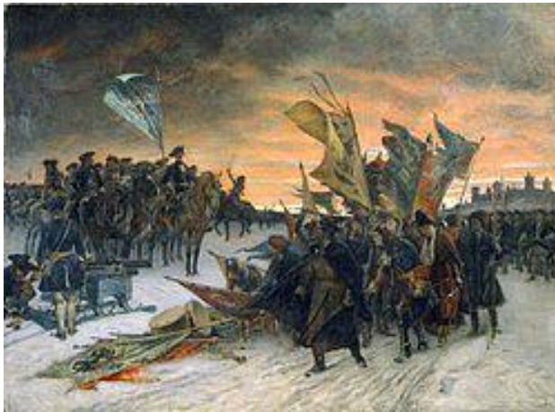
Segern vid Narva, målning av Gustaf Cederström från 1910.

När Karl XII efter denna snabba framgång förberedde en undsättningsexpedition till Livland nåddes han i Blekinge av underrättelsen att även tsar Peter förklarade krig och börjat belägra Narva. Sedan han den 6 oktober landstigit vid Pernau fick han veta att August den starke hade upphävt sin fruktlösa belägring av Riga. Karl XII skred nu i stället till Narvas undsättning. Vid ankomsten till trakten av Narva yrkade han på ett omedelbart angrepp på de ryska linjerna, och under ledning av Carl Gustaf Rehnskiöld vann så svenskarna den 20 november den lysande segern i slaget vid Narva, en av den svenska militärhistoriens största segrar. Under vintermånaderna, medan Karl XII övade sina trupper i trakten av Dorpat (själv residerade han i slottet Lais), stärkte kung August sitt förbund med tsar Peter genom ett personligt möte med denne i Birsen år 1701. Han avtvingade tsaren löfte om betydande subsidier och ryska hjälptrupper, och hoppades att därigenom bli i stånd att under sommarens fälttåg erövra Riga. Samtidigt med detta var det tänkt att tsar Peter genom anfall på Ingermanland skulle oroa svenskarna. Karl XII beslöt sig emellertid för att uppsöka och krossa kung Augusts egen krigsmakt i Kurland, och vände sig sålunda på sommaren 1701 mot trakten av Riga. Den 9 juli gick han över floden Düna med de svenska trupperna, och på flodens södra strand mötte han och besegrade den sachsiska armén i slaget vid Düna. Efter detta kunde svenskarna sätta sig i besittning av Kurland.