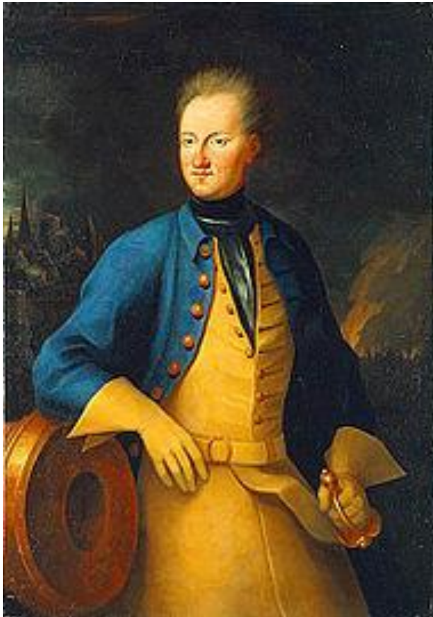
Karl XII i Bender. Målning av Axel Sparre (1715).

Den befälhavande generalen Adam Ludvig Lewenhaupts beslut att kapitulera har kritiserats hårt, både av samtiden, inte minst av Karl XII själv, och av eftervärlden. Den svenska armén borde ha tagit upp striden med Mensjikov, som hade numerärt underlägsna trupper, har man menat.