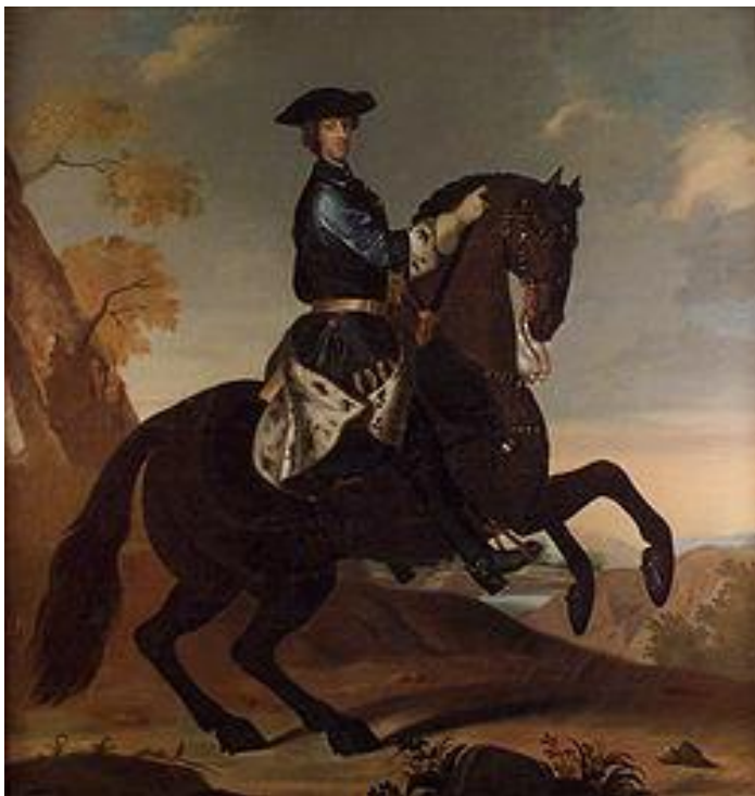
Karl XII till häst.

I augusti 1707 bröt Karl XII med en till stor del nyvärvad och välutrustad armé upp från Sachsen. Det återstod nu för honom att besegra tsar Peter för att framtinga en fördelaktig och