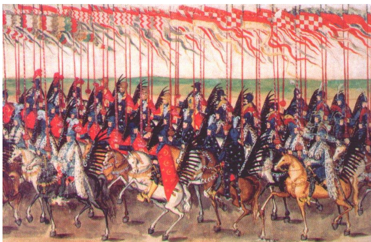
Bevingade husarer, parad i Krakow 1604 vid Sigismund Vasas bröllop

"Ty marken började darra; och upp från terrängvågor på fältet till höger om hela sachsiska uppställningen, snett fram mot de vänsterdrivande svenskarna, kommo plötsligt vid pass 10 000 ryttare travande, i fyra mäktiga slaglinjer bakom varandra, i all krigets yttersta pomp och magnificiens. Det var Hieronymus Lubomirski med Kronármen, som just i detta ögonblick hunnit fram för att vara med om segern." (Frans G Bengtsson)