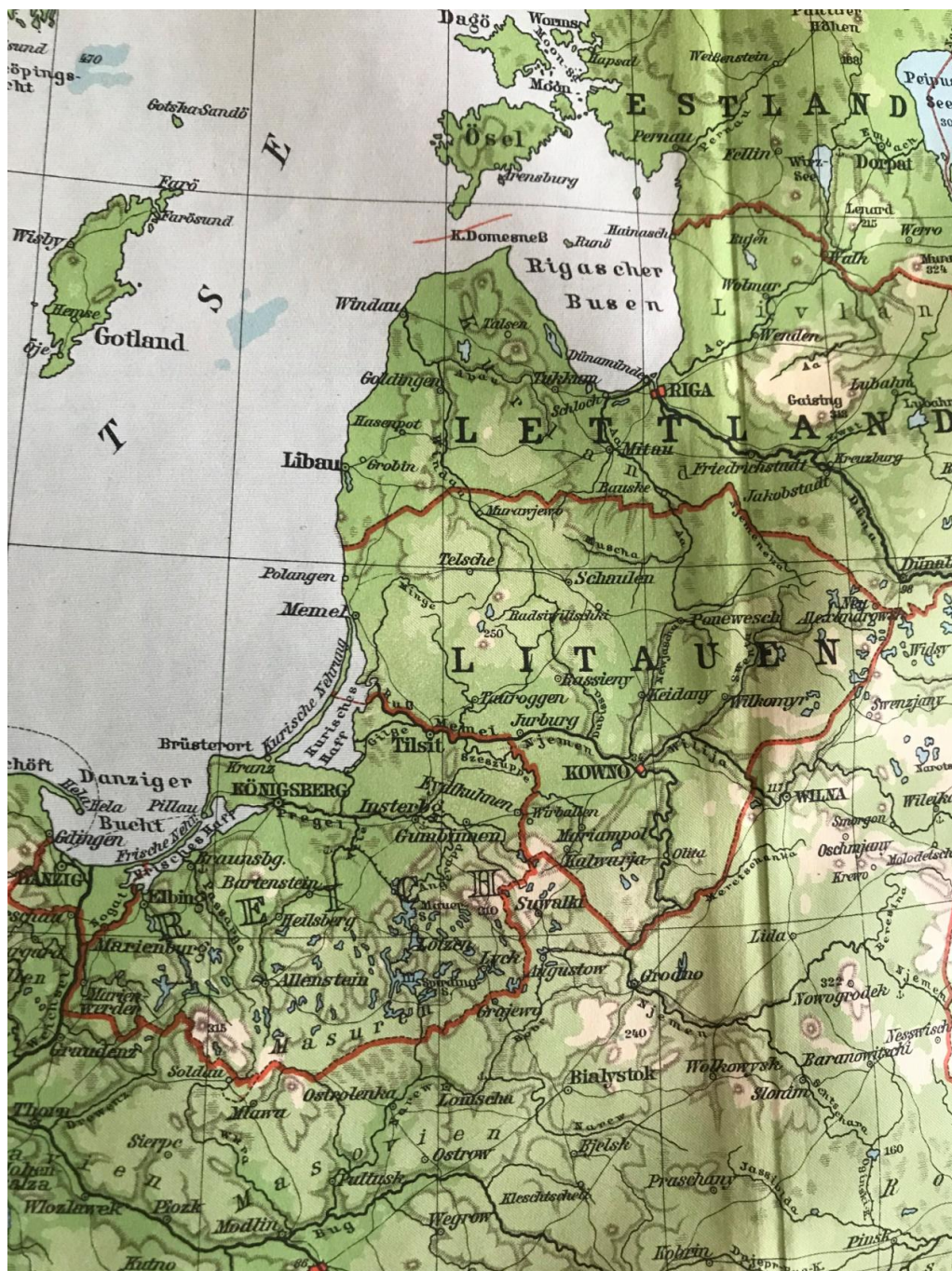
Baltisk staterna och Ostpreussen 1935