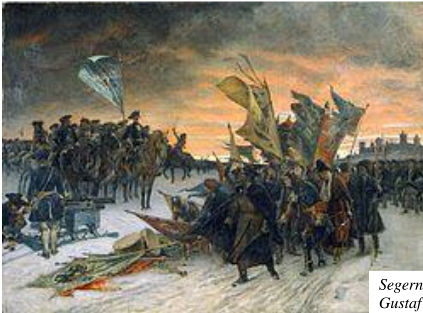
Segern vid Narva, målning av Gustaf Cederström från 1910.

När Karl XII efter denna snabba framgång förberedde en undsättningsexpedition till Livland nåddes han i Blekinge av underrättelsen att även tsar Peter förklarar krig och börjat belägra Narva. Den 6 oktober, efter landstigningen vid Pernau, fick han veta att August den starke hade upphävt sin fruktlösa belägring av Riga. Karl XII skred nu i stället till Narvas undsättning. Vid ankomsten till trakten av Narva yrkade han på ett omedelbart angrepp på de ryska linjerna, och under ledning av Carl Gustaf Rehnskiöld vann så svenskarna den 20 november den lysande segern i slaget vid Narva. En av den svenska militärhistoriens största segrar. Under vintermånaderna, medan Karl XII övade sina trupper i trakten av Dorpat (själv residerade han i slottet Lais), stärkte kung August sitt förbund med tsar Peter. Han avtvingade tsaren löfte om betydande subsidier och ryska hjälptrupper, och hoppades att därigenom bli i stånd att under sommarens fälttåg erövra Riga. Samtidigt med detta var det tänkt att tsar Peter genom anfall på Ingermanland skulle oro svenskarna. Karl XII beslöt sig emellertid för att uppsöka och krossa kung Augusts egen krigsmakt i Kurland, och vände sig sålunda på sommaren 1701 mot trakten av Riga. Den 9 juli gick han över floden Düna med de svenska trupperna, och på flodens södra strand mötte han och besegrade den sachsiska armén i slaget vid Düna. Efter detta kunde svenskarna sätta sig i besittning av Kurland.