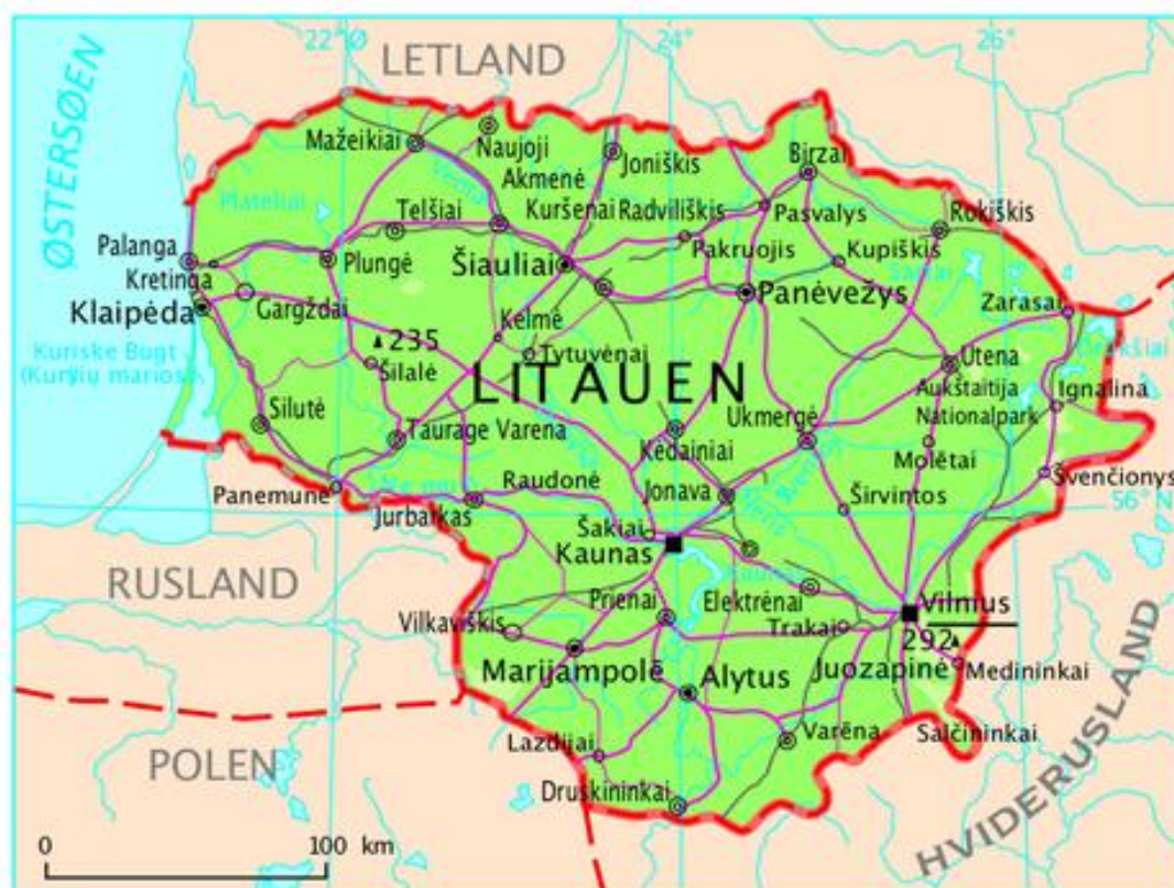
Karta över dagens Litauen