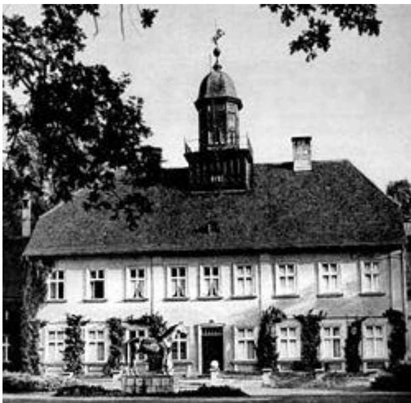
Det berömda stuteriet i Trakehnen.

De viktigaste industrigrenarna var brännvinsbränning, öltillverkning, textilindustri och maskintillverkning, trävaruindustri, pappers- och tegeltillverkning, torvberedning samt fartygsbygge. En specialitet för kustbefolkningen var insamling av bärnsten. Rederier inom provinsen redogjorde 1912 för 33 större fartyg. Hamnstäder var Königsberg, Pillau och Memel.