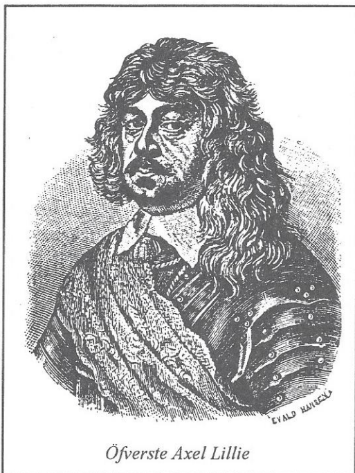
Öfverste Axel Lillie

förenade den sig med konungens trupper och sedan bar det av med rastlös fart. Den polska huvudstaden öppnade sina portar och vid Opoczno stod det första slaget. I september hade man hunnit till den befästa staden Krakau, som snart intogs. I fästningen inlades bland andra trupper två kompanier av Närkes och Värmlands regemente, vilka under Paul Würz deltog i stadens tappra försvar och