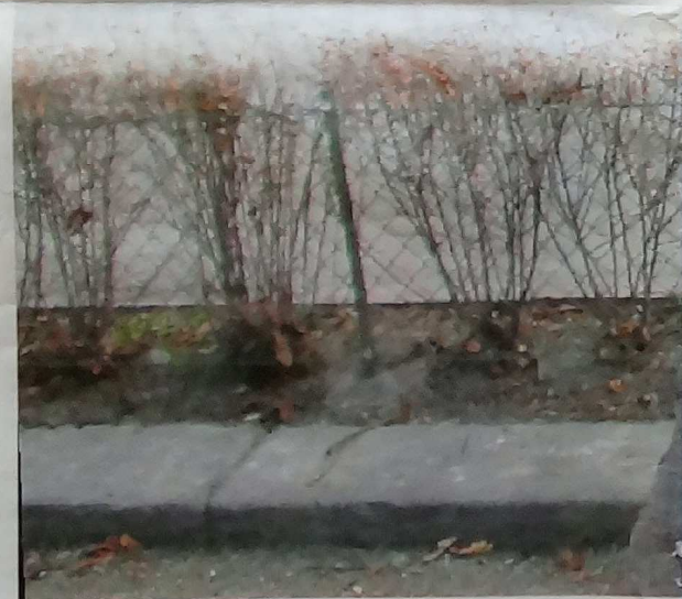
Porträtt av arkitekt Ragnar Östberg utanför Stadshuset.

Efter fjorton dagar presenterade Östberg den nya arbetsledaren för bygglaget. Oskar kände många som hade varit med på bygget av Stockholmsutställningen och de kände Oskar som rattskaffens och rejäl.