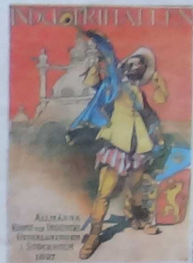
Affisch för Stockholmsutställningen 1897.