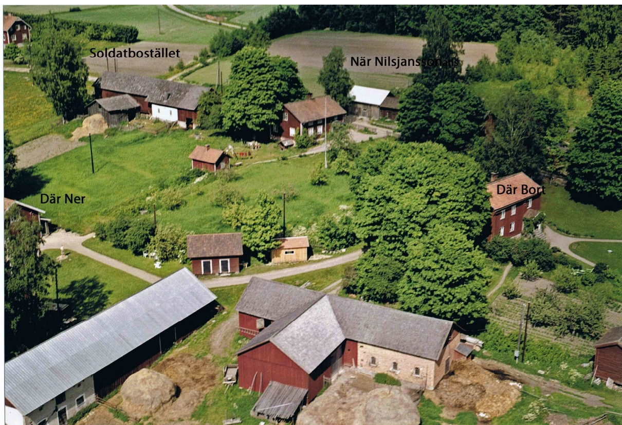
Soldattorpet och de tre gårdarna längst norrut i radbyn Askersby