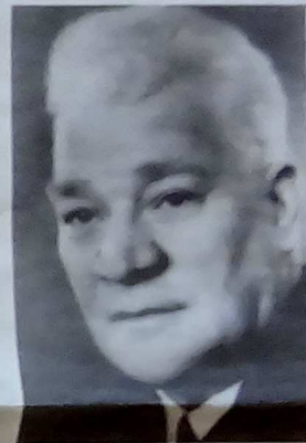
Porträtt av Oskar Asker, taget vid tiden för Stadshusets invigning.