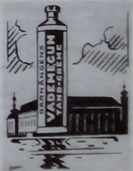
Efter invigningen blev Stadshuset utnyttjat i reklamansammanhang.