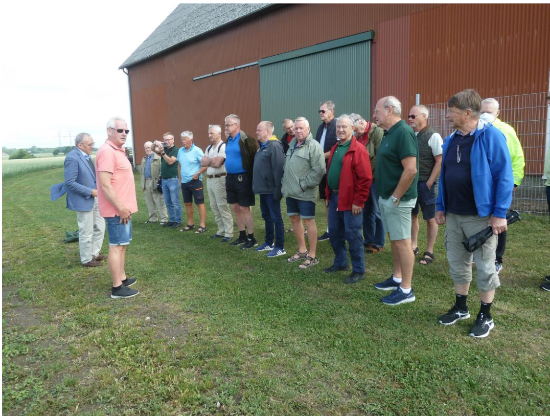
Här är hela församlingen uppställd på slagfältet vid Landskrona