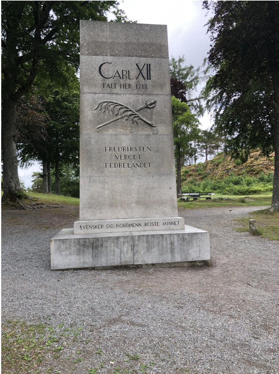
Monumentet över Carl XII:s död på Fredrikstens fästning

Huruvida kung Karl själv var en hjälte får var och en bilda sig en egen uppfattning om. Kanske var hans död äntligen slutet på en lång tid av ofred för Sverige?