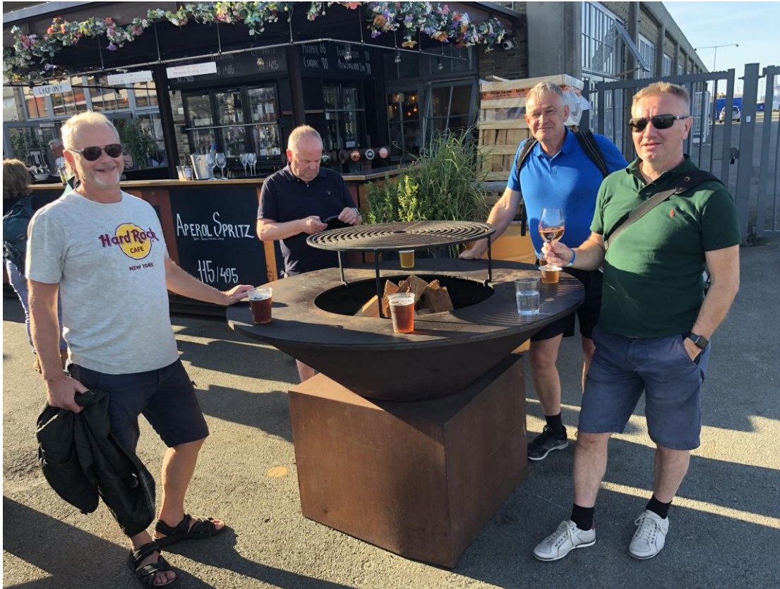
Här har grabbarna hittat ett dryckeshål.