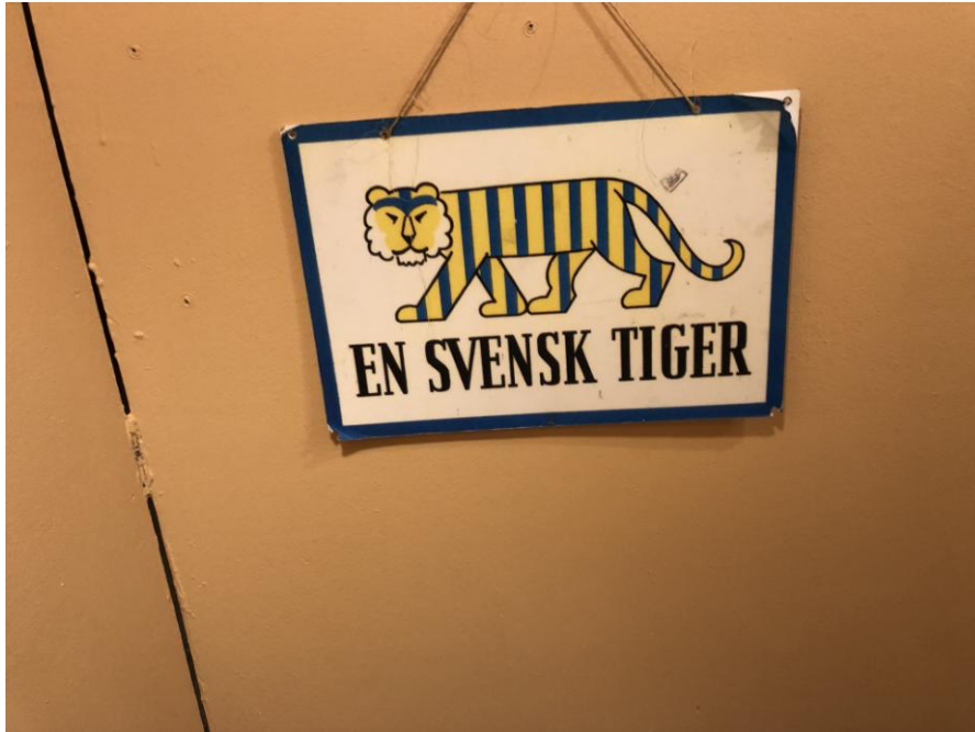
Skylten som alla kommer ihåg främst under 2:a världskriget och kalla kriget