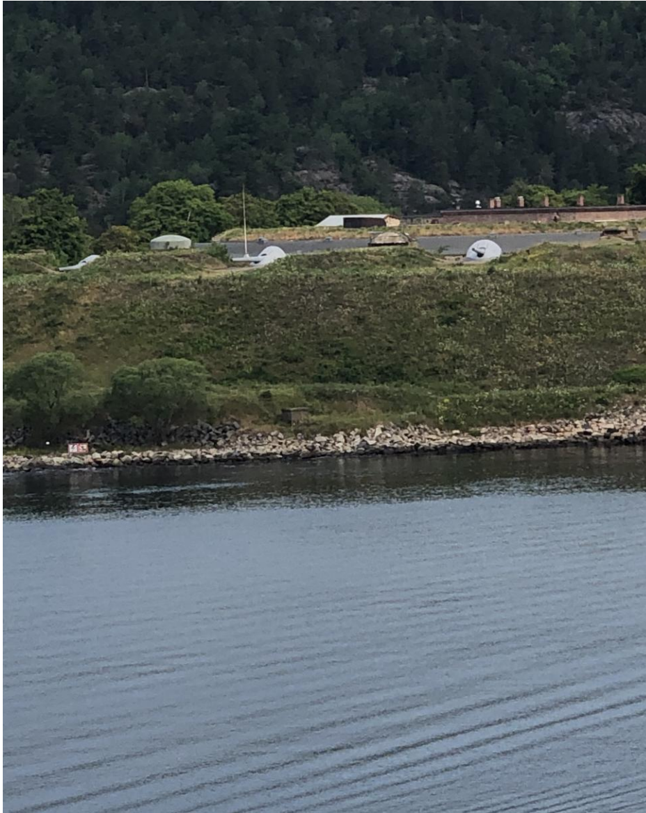
Oscarsborgs fästning med kanonerna Aron och Moses

Efter en stadig färjefrukost gick många ut på däck för att bevittna passagen av Oskarsborgs fästning samt platsen där det tyska skeppet Blücher sänkets natt till den 9 april 1940.