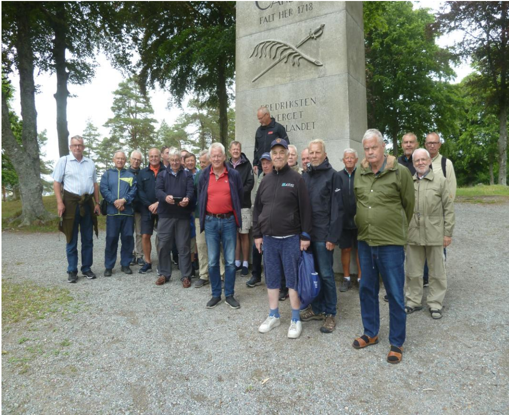
Här är hela gänget samlat framför monumentet av Carl XII

Efter att ha gått runt på den imponerande fästningen och fotograferat utsikten åt alla möjliga håll intog vi lunchen på restaurangen Den gamle kommandanten .