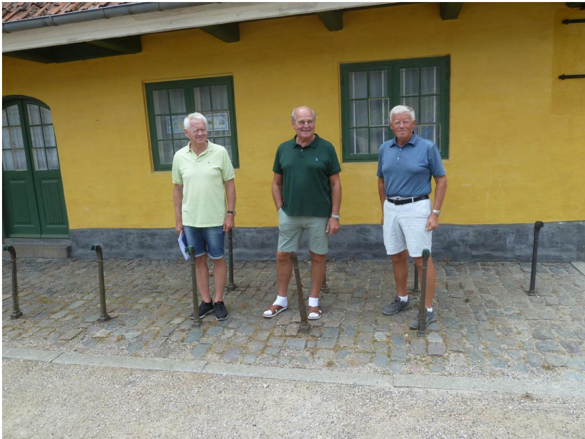
Tre gentleman på väg in på Akershus fästning

Inseglingen mot Oslo bjuder på en spektakulär naturupplevelse i den trånga fjorden och prick kl. 10.00 lade färjan till vid kaj. Nästa besök för oss var Akershus fästning och Norges Hjemmefrontmuseum.