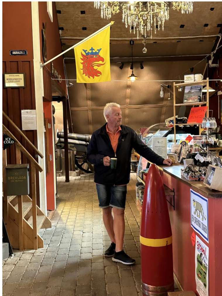
Här står vår egen museichef och samtalar med ansvariga