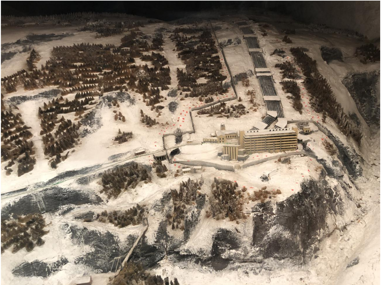
Tungvattenfabriken i Telemark