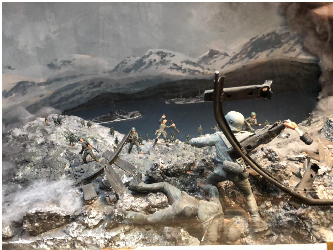
Norska motståndsmän saboterar malmbanan i Narvik Ett mycket intressant och fint uppbyggt museum.