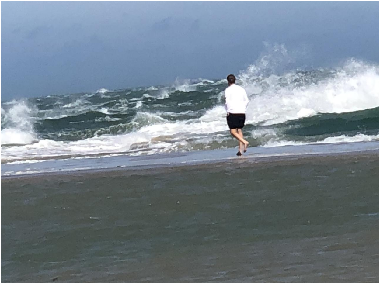
Hårda vindar på havet

Några mindre energiska deltagare valde naturligtvis en kall pils på en restaurang istället för naturupplevelsen på Grenen.