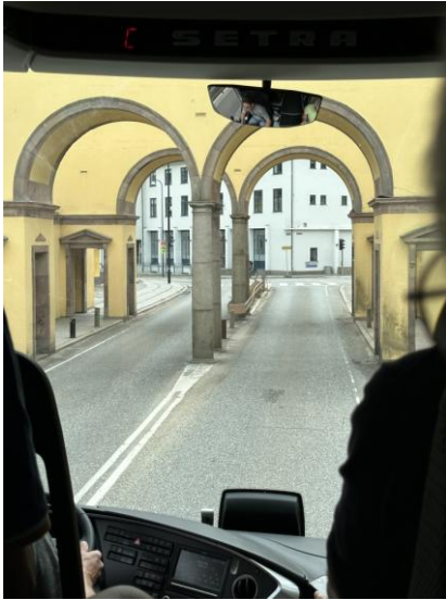
Infarten till Fredericia (tidigare Frederiksodde)

Vi startade med en enkel lunch som vi intog på café K mitt i staden. Det serverades kyckling, pommes frites och sallad och en kall pils. Efter lunchen gick hela sällskapet till monumentet "Den Tappre Landsoldaten" som blev rest efter danskarnas seger över Slesvig-Holstein 1849. Monumentet är även världens först kända symbol och staty över "Den okände soldatens grav" som först efter första världskriget blev en allmän tradition för att hedra stupade soldater.