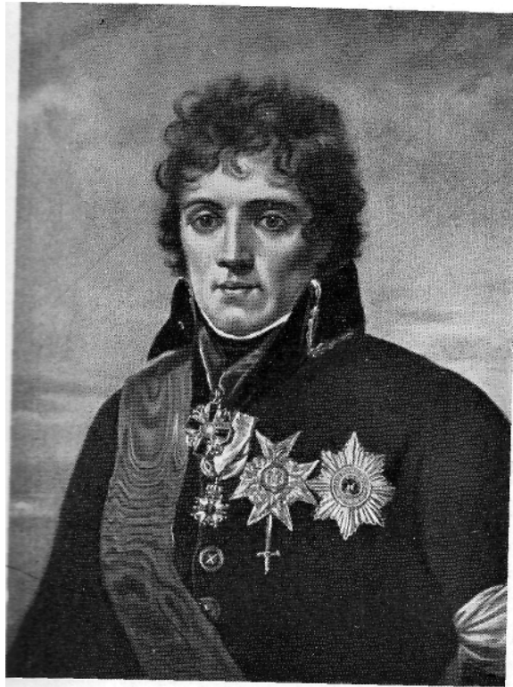
GUST. MAURITZ ARMFELT