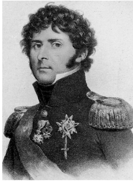
CARL XIV JOHAN