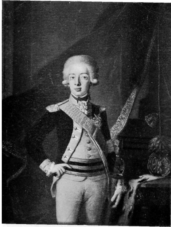
GUSTAF IV ADOLPH