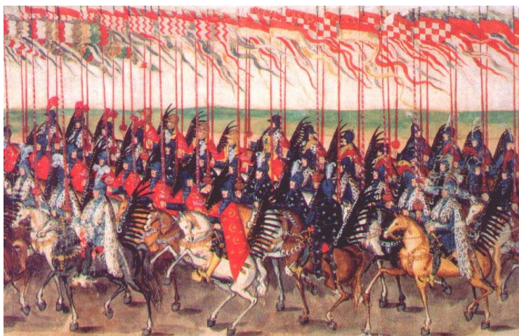
Bevingade husarer, parad i Krakow 1604 vid Sigismund Vasas bröllop

"Ty marken började darra; och upp från terrängvågor på fältet till höger om hela sachsiska uppställningen, snett fram mot de vänsterdrivande svenskarna, kommo plötsligt vid pass 10 000 ryttare travande, i fyra mäktiga slaglinjer bakom varandra, i all krigets yttersta pomp och magnificiens. Det var Hieronymus Lubomirski med Kronármen, som just i detta ögonblick hunnit fram för att vara med om segern." (Frans G Bengtsson)